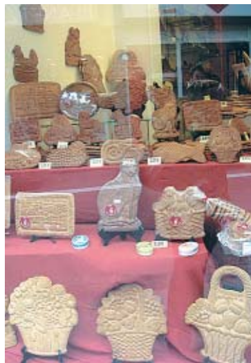
Couques de Dinant: especialidade

Para aqueles que curtem esportes de aventura, de explorar grutas e cavernas, Dinant é o local certo. Na primavera e verão europeus, muitos turistas vêm para Dinant à procura de novas e radicais emoções. Escalar montanhas, andar de qua-