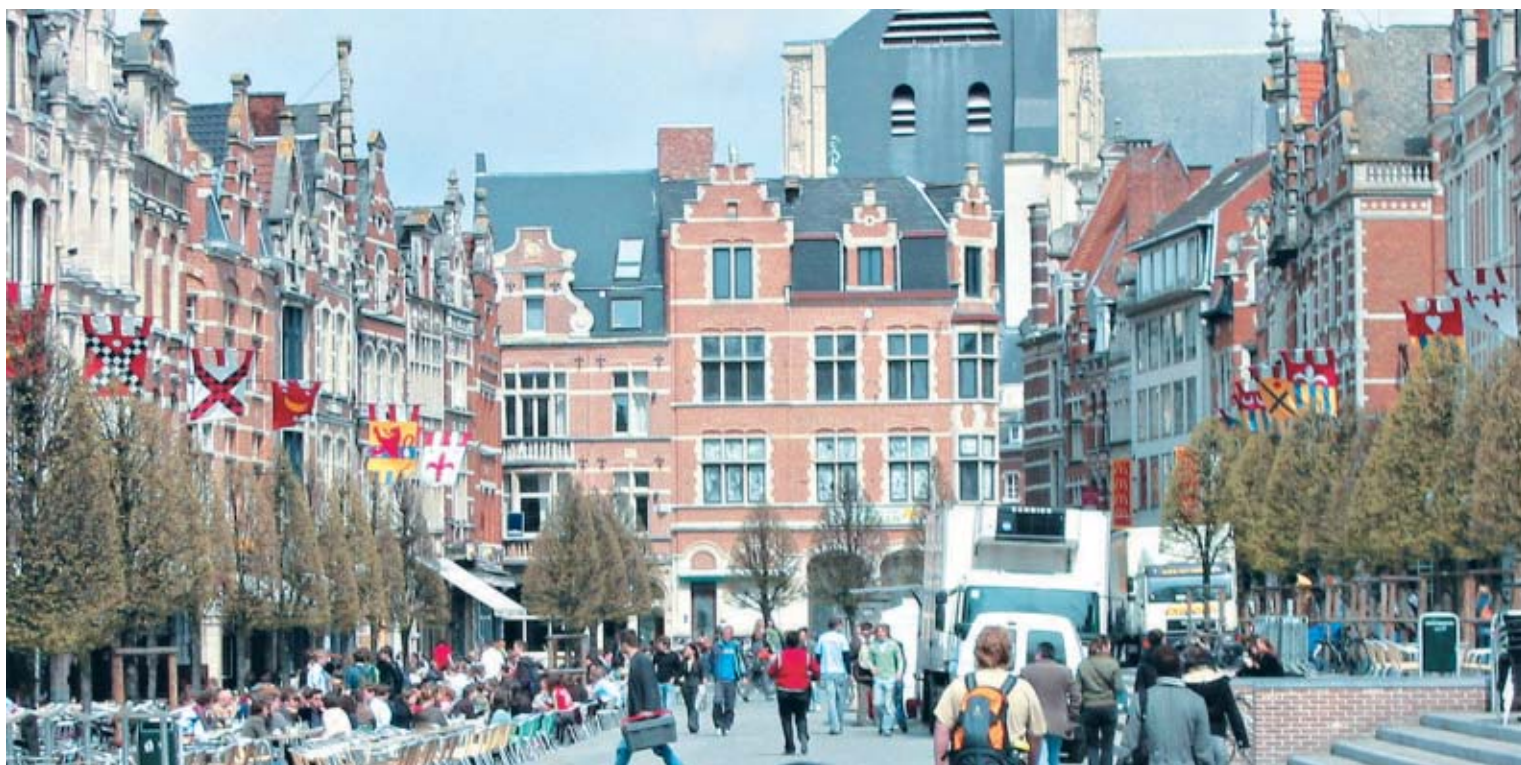
A praça principal de Lovaina é cheia de restaurantes e bares e, claro, reduto de universitários. Aliás, eles representam 70% da população local