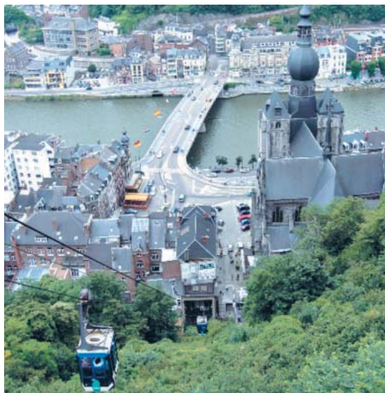
Um teleférico leva à Citatelle, uma construção no topo de um penhasco

Já na região leste fala-se o alemão e, por fim, na parte sul do país, indo em direção à França, o francês é a língua oficial e a paisagem muda completamente