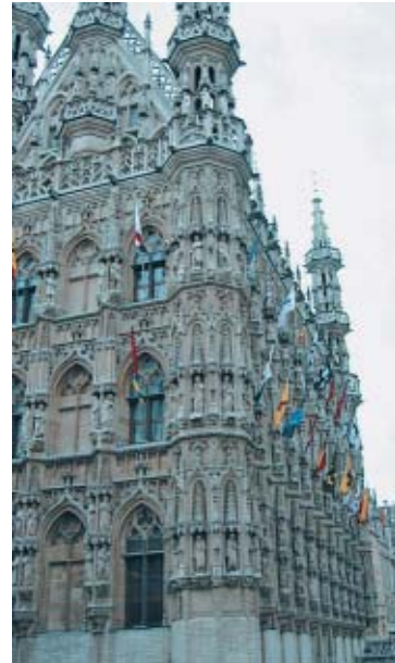
O Town Hall é uma das referências

Por abrigar centenas de estudantes, a cidade possui muitos